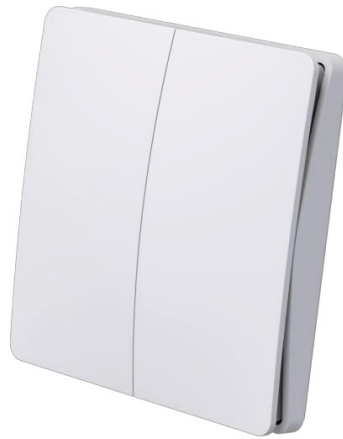
ENS-S3-4R ( 四键双侧回弹式 )